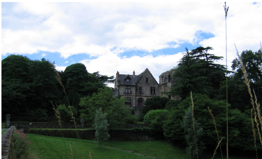
surplombant la rue de la Sicoterie, le Château de Mortagne

Pour une fois venant de Rochefort et traversant la Vendée pour rallier Fougères, nous en avons profité pour faire une halte à Mortagne sur Sèvre dans ces lieux chargés d'histoire familiale :