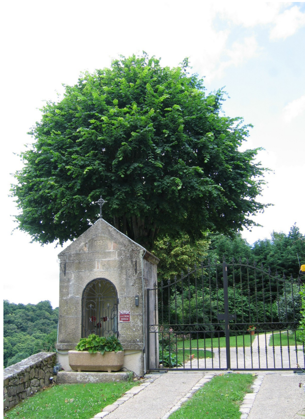
Enfin, en remontant sur les hauts de Mortagne, en direction de Saint Christophe, la chapelle St Lazare