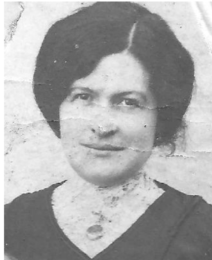
* Alina Mandineau 1887 – 1914